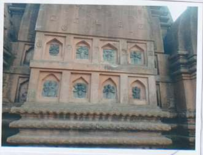
নেঘোৰিণী শিৱদৌলৰ অক্ষয়গাত অক্ষয় দেৱদেৱীৰ আৰ্ক্ষৰ ছবি ।

হেগেটা ইগেৰে অক্ষয় কৰ্ণেশ্বৰীয়া নেঘোৰিণী শিৱদৌল অহোম যুগৰ বস্তুকৰ্মৰ এক সুন্দৰ নিৰ্মাণ । দৌল অক্ষয় বেৰত অক্ষয় নানা তৰহৰ কুৰ্তি বৰ্তমানে লোণ পাৰেছে । ঘাই দৌলদেৰ গোৰিগুৰুগলে চাৰিটা দৌল আছে । এতিয়ে দৌলৰ এটা আগৰ 'হা' আছে । স্মৃতি দৌলত বান লিঙ্গ এতিয়া কহা হৈছিল । এই লিঙ্গদেৰ জেৰাৰ আয় ৩ ৩ ফুট । বাকী কেইটা সাগৰ, বিমু, দুগা জেৰা সূৰ্য দেৱতাৰ